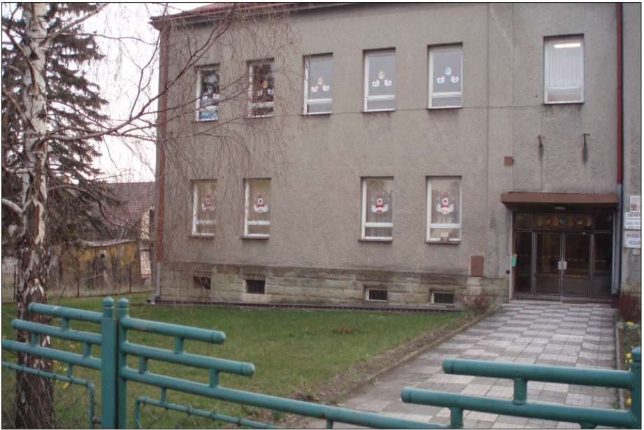
Budynek w roku 2007