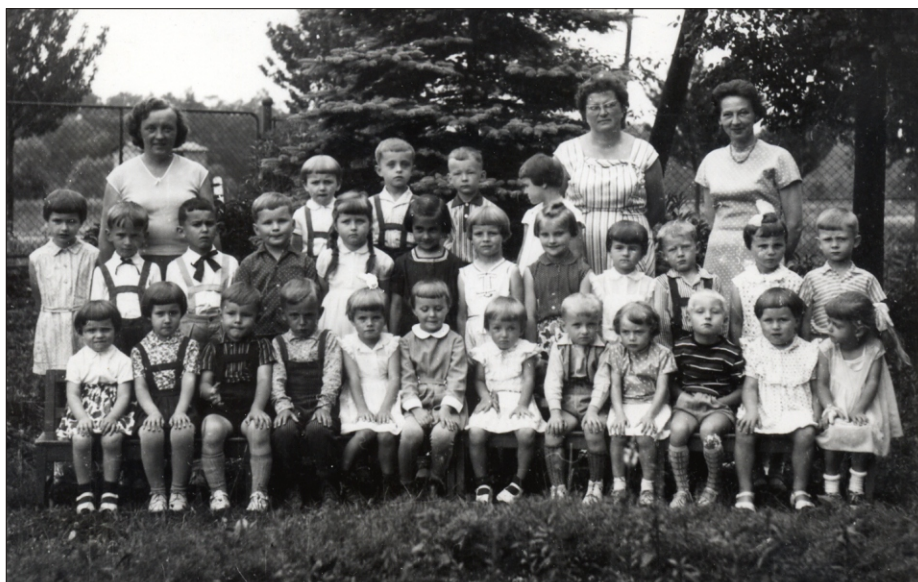
Rok szkolny 1965-66