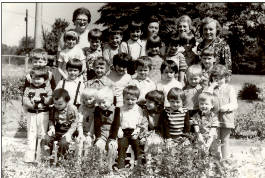
Rok szkolny 1978-79