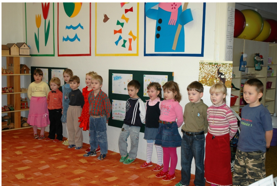
Dzień Babci 2007