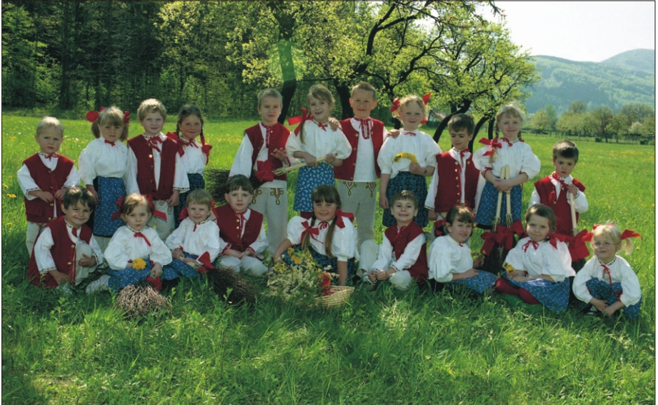
POGODA w roku 2007