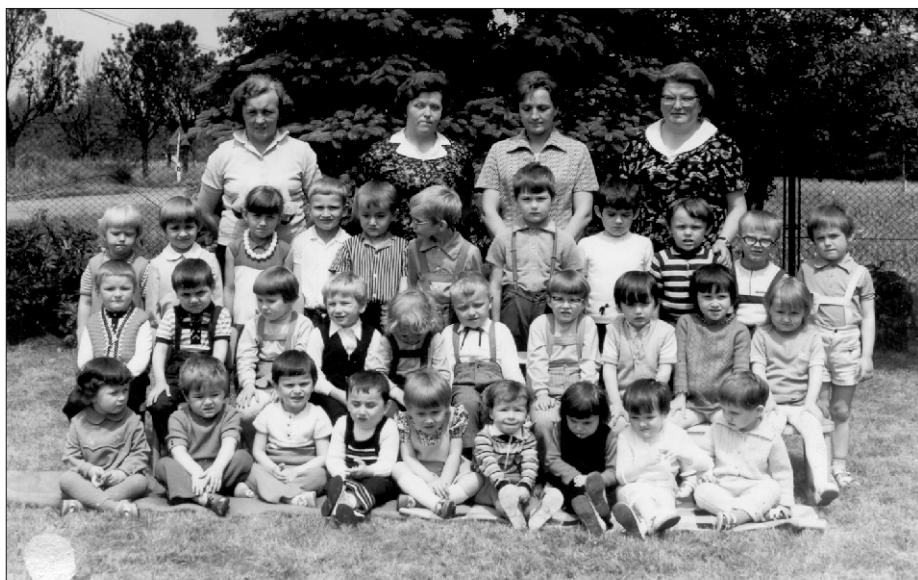
Rok szkolny 1968-69