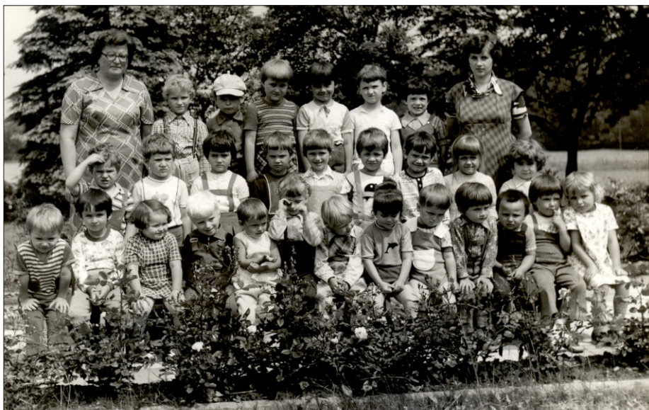
Rok szkolny 1979-80