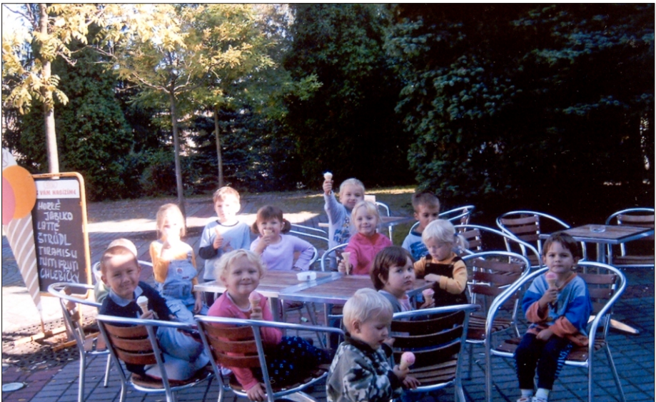
Życie w przedszkolu 2006