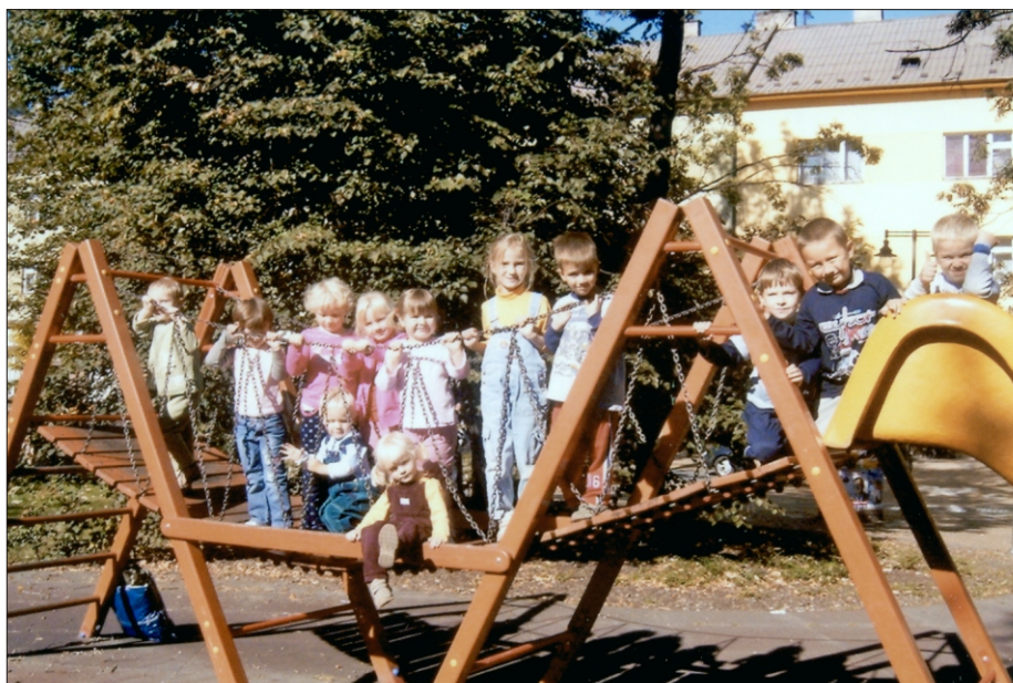
Życie w przedszkolu 2006