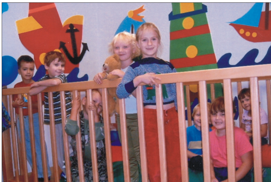
Życie w przedszkolu 2007